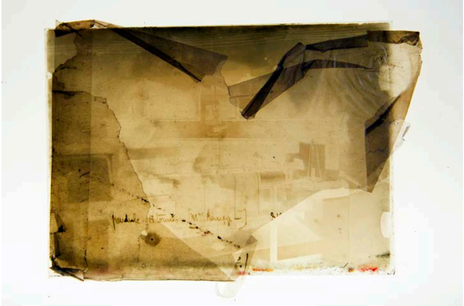
Station de sismologie (vue de l'intérieur), plaque de verre négative, vers 1910, photographie sur table lumineuse, 2019.

L'exposition monographique d'Arno Gisinger établit un dialogue entre la photographie, l'histoire des sciences et l'art sonore en transformant le bâtiment du FRAC Alsace en instrument d'expérience visuelle et physique. Comment représenter l'invisible ?