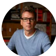
Arno Gisinger, artiste.

Arno Gisinger travaille sur les relations entre mémoire, histoire et représentations visuelles dans une perspective européenne. Il collabore régulièrement avec des chercheurs et chercheuses dans une démarche transversale et interdisciplinaire. Ses travaux récents sont marqués par une réflexion sur la monstration des images dans l'espace et leurs dimensions architecturales, institutionnelles et politiques.