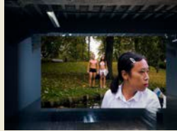
Dusk, Evelyn Taocheng Wang, 2017

Diffuser l'élégance est la première exposition monographique de l'artiste sino-néerlandaise Evelyn Taocheng Wang en France. Convoquant aussi bien les faits divers et les réseaux sociaux, que la grande littérature, Evelyn Taocheng Wang interroge la notion d'identité en tant que concept mouvant, intrinsèquement lié à l'espace et au temps.