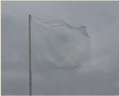
Edith Dekyndt, One Second Of Silence (Rotterdam) , 2009. Collection FRAC Alsace.

Lafayette et la liberté , une exposition autour de la figure de Lafayette et de la naissance de la Démocratie en France et aux États-Unis.