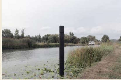
Jonathan Naas, Flood , 2018.