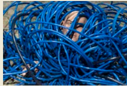
Vue d'installation à Tramway, Glasgow, Cécile B. Evans.

L'artiste belgo-américaine, Cécile B. Evans (1983), présente un ensemble d'installations vidéo architecturales intitulées AMOS' WORLD (2017- 2018). Basée à Londres, elle examine à travers ses recherches la signification et le rôle de l'émotion dans les sociétés contemporaines ainsi que l'influence croissante des nouvelles technologies sur nos sentiments et actions.