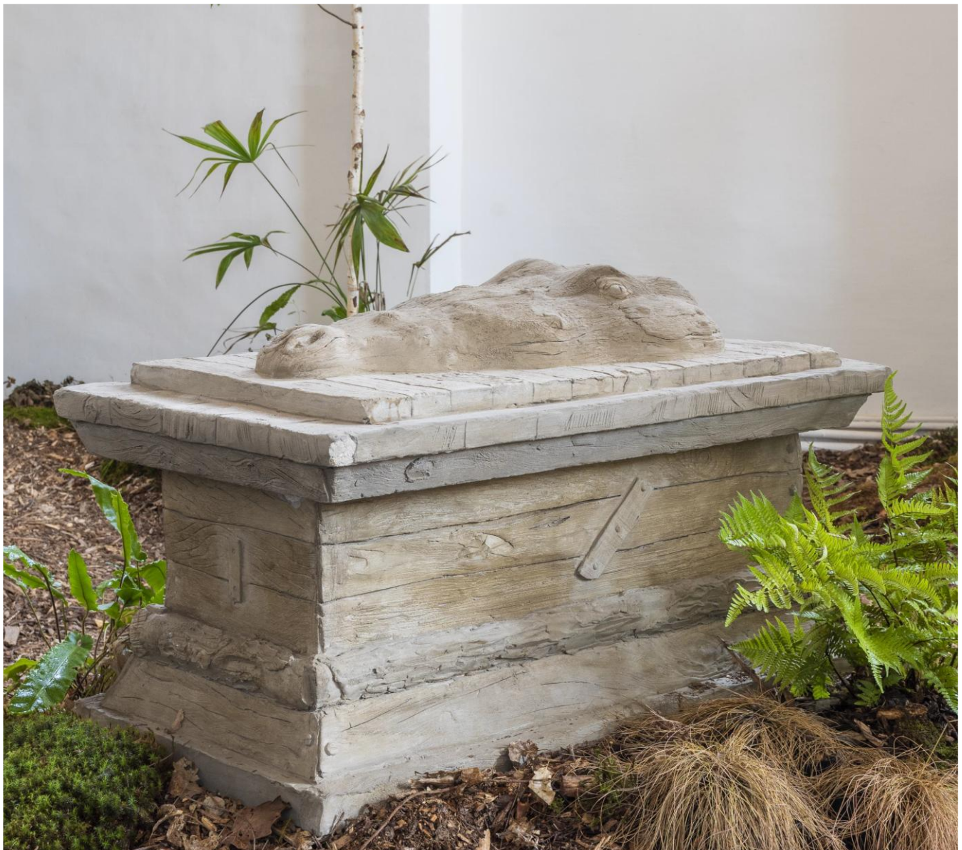
Laurent Le Deunff, Crocodile , 2020, Ciment type rocaille, 80 x 126 x 72 cm, Galerie Semiose © ADAGP 2026, Paris