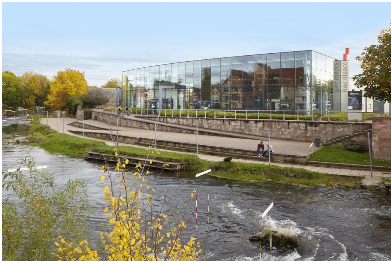
Vue du FRAC Alsace, 2020