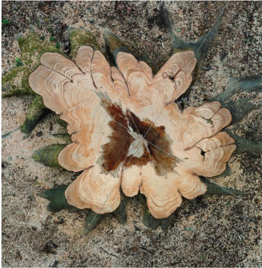
Photographie numérique sur papier 62 x 61 x 3 cm