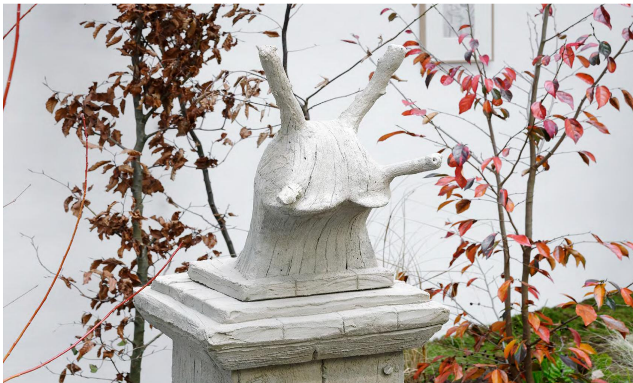
Laurent Le Deunff, Tête d'escargot , 2020, Ciment type rocaille, 143 x 50 x 56 cm, Galerie Semiose © ADAGP 2026, Paris