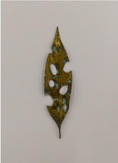
Sculpture en laiton, 12 x 3cm