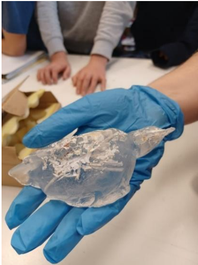
Os et cendres d'oiseaux, cristal, « pâte de verre », 7 pièces