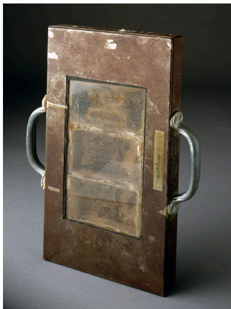
Dreiklang , 1967