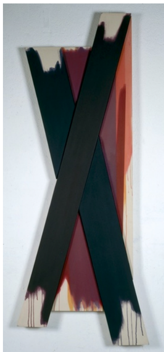
Red Crossing , 1982 Acrylique sur toile Année d'acquisition : 1983 Collection FRAC Alsace © Godwin Hoffmann

“Le fondement de la peinture et des préoccupations de Godwin Hoffmann est sa volonté de faire de l'œuvre d'art une réalité autonome, de créer, comme les peintres américains de la “post-painterly abstraction”, des œuvres “concrètes” qui ne soient pas œuvres de “représentation” ou d'imitation de la réalité extérieure, mais créations pures, trouvant leur justification en elles-mêmes. [...]