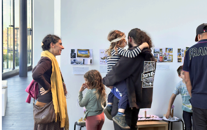
Restitution d'un atelier de création au FRAC Alsace, 2026