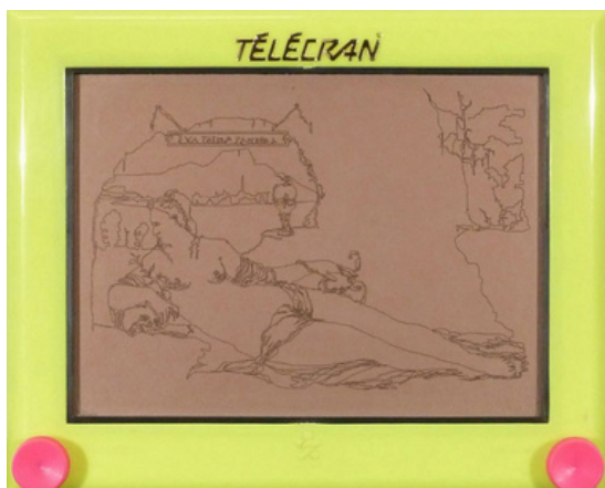
Eva prima pandora , 1991 Télécran Année d'acquisition : 1992 Collection FRAC Alsace © Stéphane Lallemand

Les Télécrans (1989-1993) sont un jouet qui permet à son utilisateur de créer une image à l'aide de deux boutons, une variante de l'ardoise magique, dont l'artiste dit qu'il lui a donné l'occasion de retrouver la "fascination" ressentie "face aux applications multiples de la géométrie élémentaire qu'[il] avait développées dans ses sculptures" – le simple déplacement du curseur lui permettant d'"obtenir l'image d'un tableau de Titien".