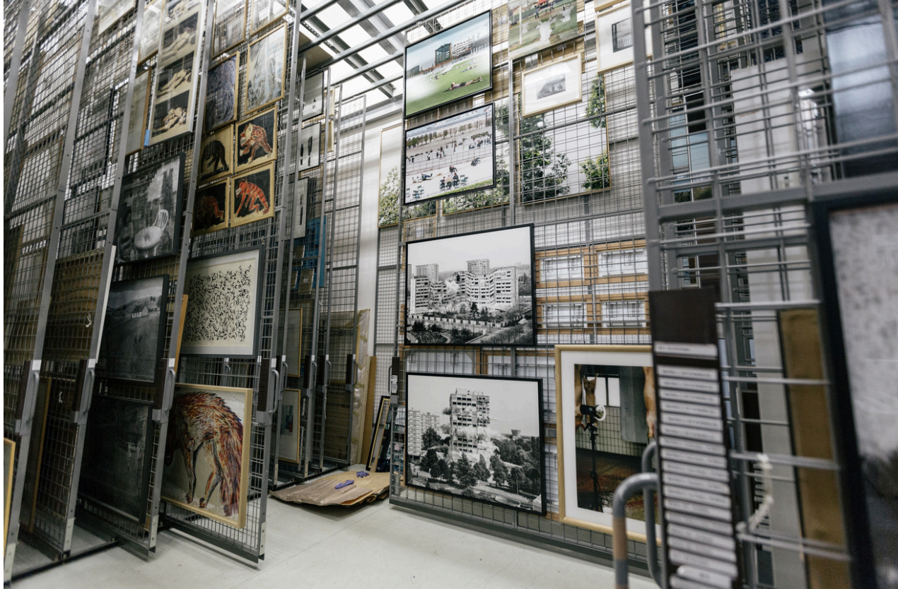
Vue des réserves du FRAC Alsace