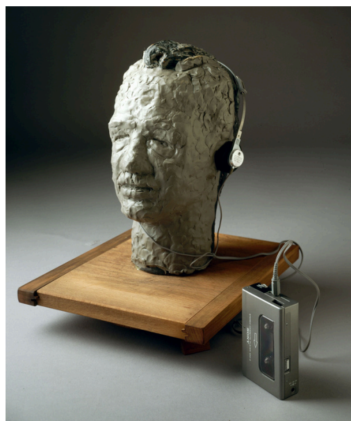
Le masque de Sarkis ou le buste en pâte à modeler qui écoute le walkman , 1982

Pâte à modeler, plâtre, bois, discman, casques d'écoute