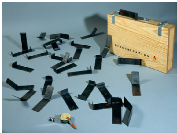
Dissémination A , 1982 29 sculptures en acier forgé peint à disséminer dans l'espace qui accueille l'œuvre Année d'acquisition : 1983 Collection FRAC Alsace © Jean-Marie Krauth

“La sculpture intitulée Dissémination A , constituée d'un nombre indéterminé d'éléments réguliers et disposés en divers lieux, choisis par l'artiste, s'inscrit dans l'incessante remise en question du rôle, du statut et de la légitimité de l'œuvre d'art, amorcée depuis plus d'un demi-siècle. [...]