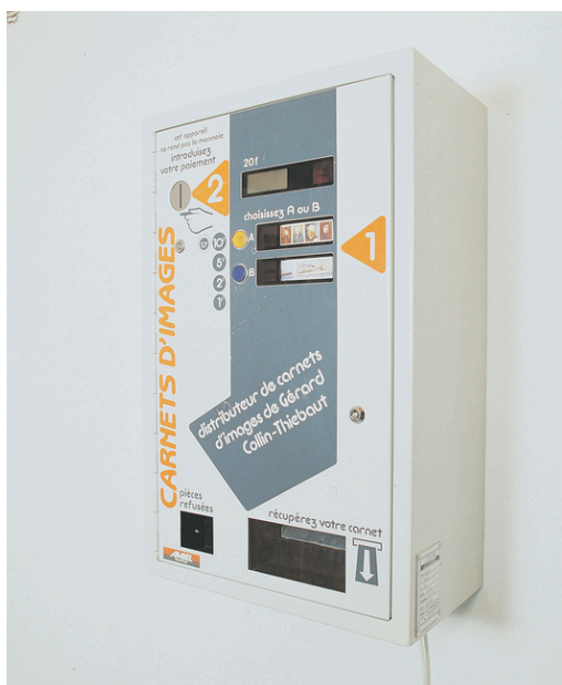
Distributeur d'images, 1992

Distributeur automatique de carnets d'images