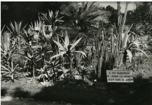
Ordo ab chao Kodak , 1982