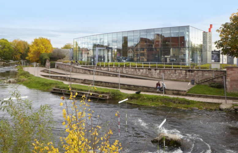
FRAC Alsace à Sélestat